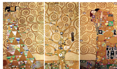
L'Arbre de vie, 1905-1909.